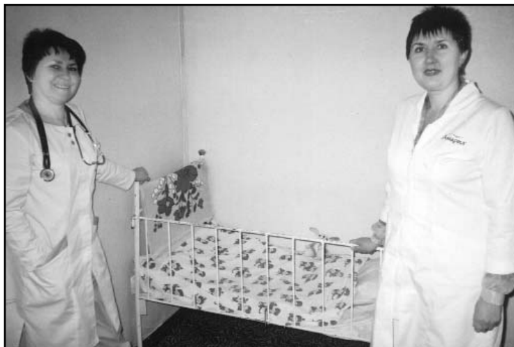
Bettwäsche auch für die Kleinsten...

Gespendet wurden diese Ausstattungen vom München Stift und der Firma EMESS - einem großen Münchner Herenausstatter und einer Vielzahl von Privatpersonen.