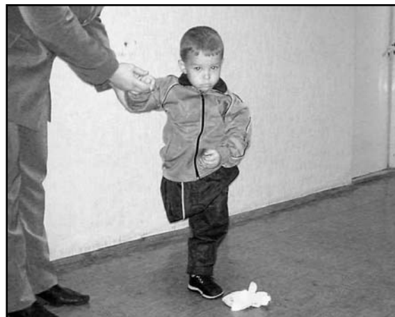
Ein kleiner Junge stellt sich vor - Amputation nach Verkehrsunfall. Er wünscht sich eine Prothese...